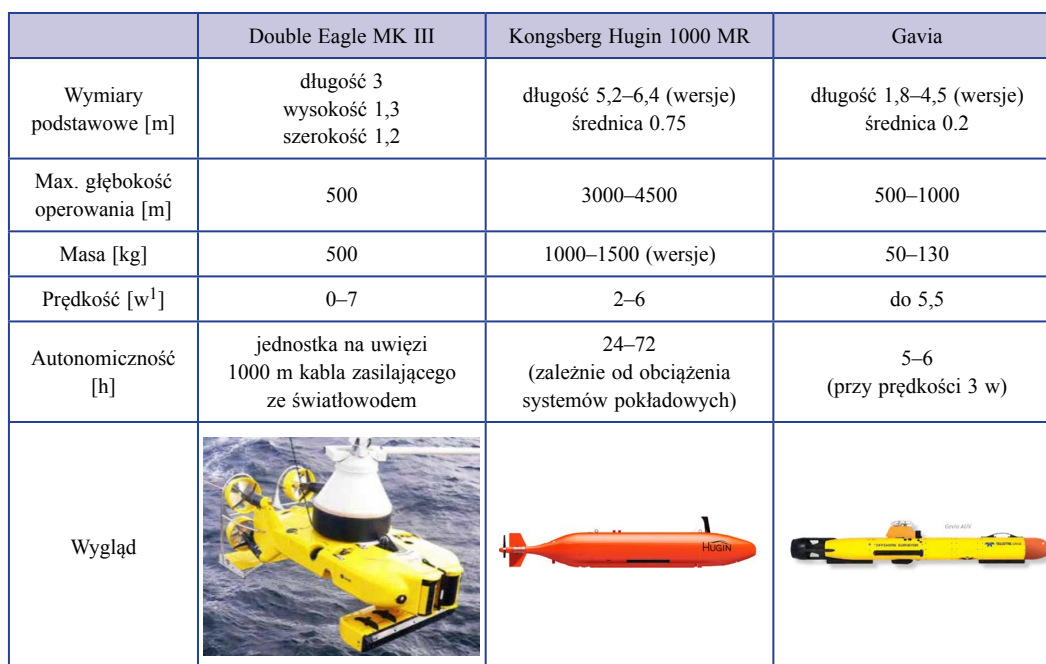
TABELA 2. Zestawienie podstawowych danych wybranych pojazdów autonomicznych używanych przez MW RP TABLE 2. Basic characteristics of dedicated autonomous underwater vehicles used in the Polish Navy