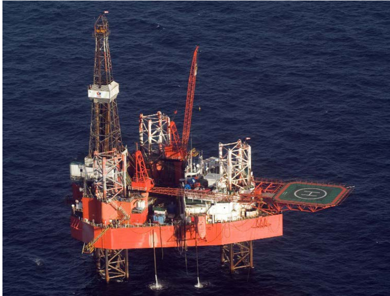
Fot. 1. Prowadząca eksploatację złoża B8 platforma wiertnicza Petrobaltic