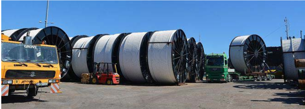
Fot. 2. Rolki z nawiniętym rurociągiem (przeciętny ciężar każdej z 21 dostarczonych w ostatnim transporcie rolek to 50 ton – 2–2,2 km gazociągu) tuż po wyładowaniu transportu z Houston do Gdańska (łącznie zakupiono 53 rolki)