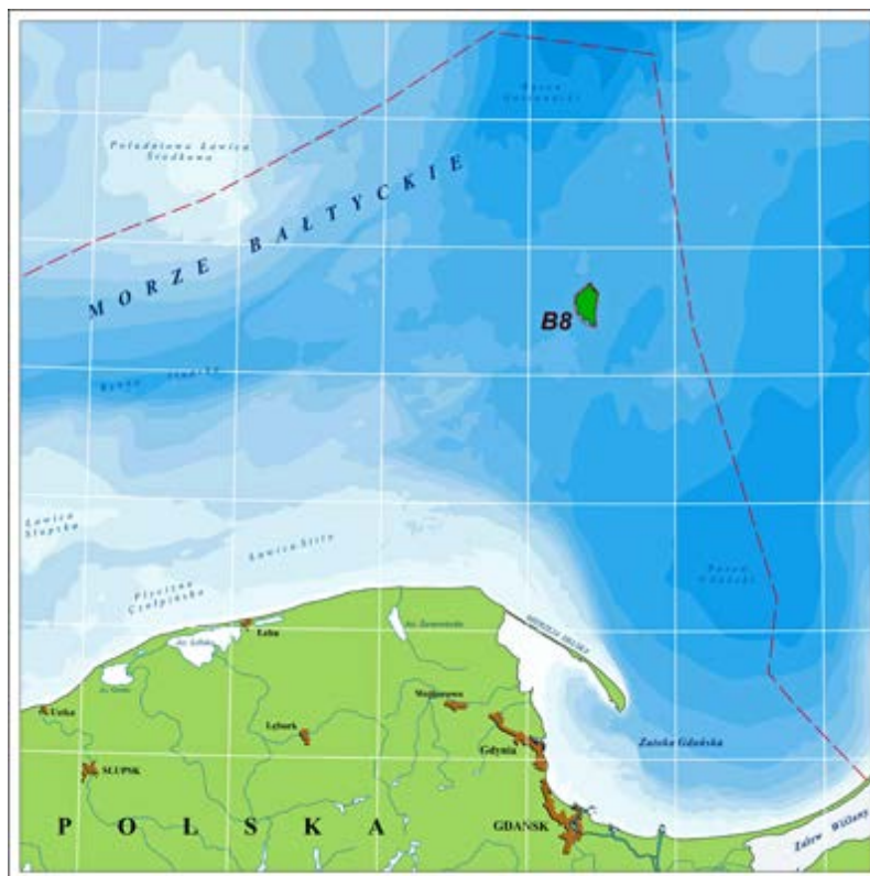
Rys. 1. Umiejscowienie złoża B8 na polskich obszarach morskich (wyłączna strefa ekonomiczna ang. Exclusive Economic Zone – EEZ)