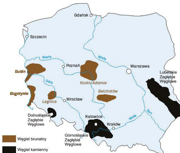
Rys. 1. Występowanie złóż węgla kamiennego i brunatnego w Polsce (Lubosik 2017)

Udokumentowane zasoby bilansowe złóż węgla kamiennego według stanu na 31.12.2017 r. wynoszą 60.496 mln Mg. Prawie 3/4 zasobów (70,67%) to węgle energetyczne, ponad 1/4 (28,03%) to węgle koksujące, a inne typy węgla stanowią 1,30% wszystkich zasobów węgla. Węgle energetyczne wykorzystywane są do wytworzenia prawie 50% energii elektrycznej w Polsce. Zasoby złóż zagospodarowanych stanowią obecnie 37,19% zasobów bilansowych i wynoszą 22 497 mln Mg (Bilans... 2018). Rocznie w Polsce wydobywa się ponad 63 mln Mg węgla kamiennego.