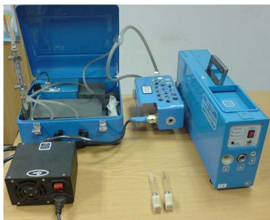
Rys. 2. Spektrometr RA-915+ z przystawką RP-91C

Popiół lotny wykorzystany w badaniach zawartości rtęci został pobrany z jednej z polskich elektrowni spalającej węgiel kamienny i wykorzystującej do tego celu kocioł fluidalny o mocy 70 MW. Badania były przeprowadzone przy obciążeniu kotła wynoszącym 50, 75 i 100% jego mocy znamionowej. Test przy każdym obciążeniu trwał 48 godzin, pomiędzy poszczególnymi zmianami obciążenia zastosowano 12-godzinne przerwy w celu wymiany warstwy fluidalnej złoża. Przy każdym obciążeniu pobierano próbki paliwa, popiołu lotnego i dennego oraz sorbentu. Paliwem były węgiel kamienny oraz muł węglowy podawany w ilości około 10%. Podczas każdego testu do badań pobrano cztery próbki paliw i popiołów. Zawartość rtęci w próbkach była oznaczana przy użyciu spektrometru Lumex RA-915+, wyposażonego w przystawkę RP-91C. Analizator wykorzystuje technologię efektu Zeemana (Zeeman Atomic Absorption Spectrometry with High Frequency Modulated Light Polarization (ZAAS-HFM)), który pozwala na rezygnację z konieczności akumulowania rtęci na złotym sorbencie (rys. 2).